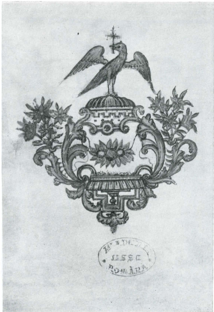
Fig. 11. Ms. grec 1149, f. 151; Vinieta cu vulturul țării Românești.

a mesei în spre fundalul icoanei miniaturate. La spatele împăratului sînt înfățișați doi ofițeri de gardă, în platoșe și coif. Deasupra împăratului, care are sceptrul în mîna dreaptă, iar stînga ridicată pentru judecată, se vede cerul înstelat (redat în verde), care-și revarsă razele asupra participanților. Coloritul tabloului este foarte expresiv și deosebit de variat, ca al tuturor tablourilor, de altfel; hainele sacerdotale sînt redat în gri, roșu, verde, portocaliu, aur, castaniu, liliachiu.