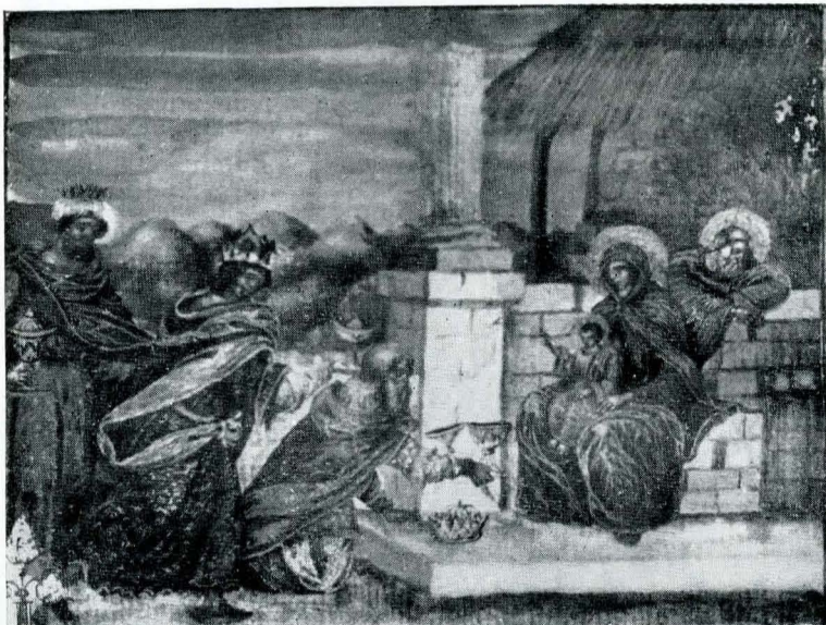
Fig. 3. Ms. grec 113, f. 11 v; Închinarea magilor.