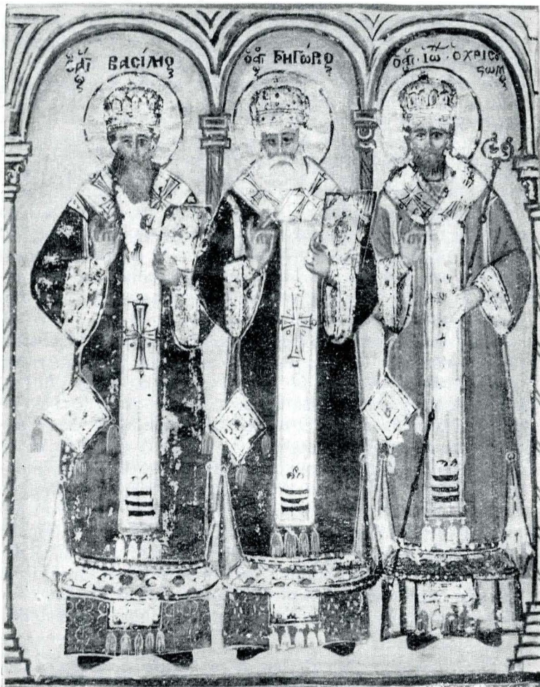
Fig. 14 Ms. grec. 1149, f. 164 v.; Stînții Vasile, Grigorie și Ioan Gură de Aur.