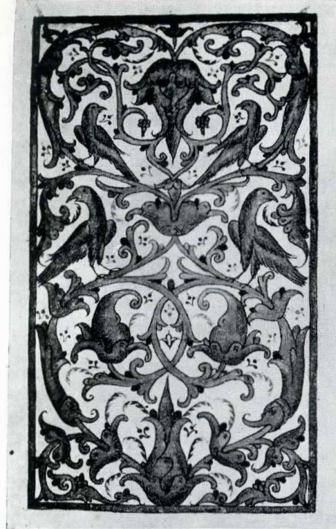
Fig. 24. Ms. grec 1096, f. 29.