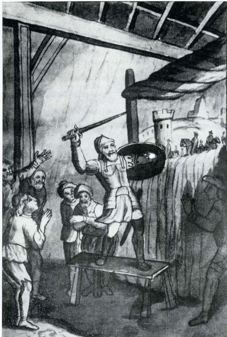
Fig. 18. Ms. grec 1471, f. 195; Don Quijote și teatrul de păpuși.

Ultimul laviu, de la fila 391 înfățișează sfîrșitul ocîr-muirii insulei Barataria de către Sancho 38 . Speriat în miez de noapte de niște „supuși”, precum că insula ar fi atacată de vrăjmași, Sancho, neavînd încotro, se lasă legat, gol, între două scînduri, care să-i țină loc de paveze, în față și în spate. În această poziție ridicolă, cu lancea în mîna dreaptă, îl înfățișează ilustratorul, ieșind din casă, înconjurat de slujitori. Mai jos, în prim plan, alți participanți la această farsă, cu săbiile scoase și cu torțele pe jumătate ascunse, ca să nu poată fi recunoscuți, îl așteaptă pentru lupta, care, cum se știe, n-avea de ce să aibă loc.