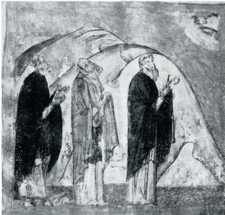
Fig. 7. Ms. grec 1294, f. 2.

În ceea ce privește coloritul, acesta întrece orice așteptare, prin varietate și prospețime, în pofida atitor sute de ani în care codicele n-a încetat să fie răsfait. Pe fondul de aur sînt folosite culorile: gri, verde, portocaliu, maron, albastru, liliachiu, galben, cu o infinitate de nuanțe; toate lasă impresia că sînt date cu lac, atît de strălucitoare apar.