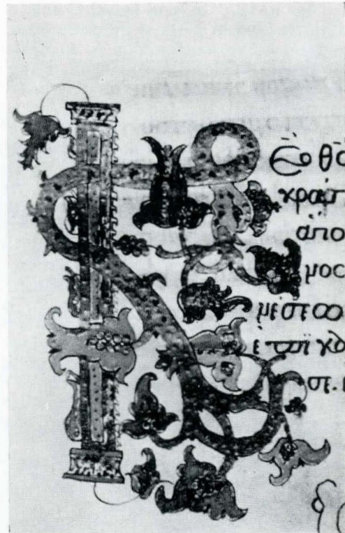
Fig. 26. Ms. grec 1444, f. 17; Litera K.

căror frumusețe n-o poate reda condeiul, ci doar reproducerea colorată. Amintim, în treacăt, frontispiciile și inițiala O de la f. 4 v și 31 v , inițiala K de la f. 7 cu elemente zoomorfe, care sînt însă mai rare, ca spre pildă la f. 20 (litera M), sau la f. 22 v (litera T); tot K (cea mai numeroasă literă împodobită) la filele 7 v , 11, 12 v , 17, 43, 70 v etc., inițiala D la f. 8 v , 18 v , 34, 79 v inițiala E la f. 10, 13 v , 28, 36 etc., majuscula P la f. 14 v , 27 v , 83 v etc., M la f. 48 și multe altele. Este de remarcat că deși unele inițiale seamănă, ele nu sînt nici pe departe copiate, iar coloritul, deosebit de variat, atestă un artist de o mare fantezie creatoare.