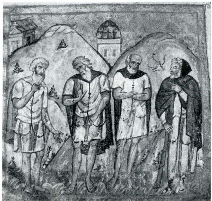
Fig. 10. Ms. grec 1294, f. 8.

Fondul acestui tablou este redat în aur, spre deosebire de ale celorlalte sinoade, care sînt redat în roșu sau verde.