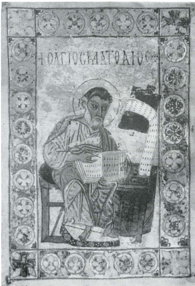
Fig. 6. Ms. grec 1175, f. 9 v; Evanghelistul Matei.

răm perfecta cunoaștere a canoanelor picturale bizantine. Demn de semnalat este și faptul că nici o figură nu seamănă cu cealaltă.