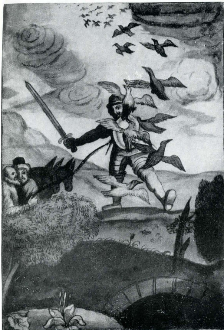
Fig. 17. Ms. grec 1471, f. 167; Don Quijote coboară în grotă de la Montesinos.

A doua miniatură, redată la f.167, îl înfățișează pe Don Quijote pe punctul de a cobori în grotă de la Montesinos. Legat de mijloc cu o coardă, pe care o ține Sancho Panza și însoțitorul lor, un amator de cărți cavaleriești, Don Quijote își face loc cu sabia printre mărăcini, în timp ce un stol de ciori și de coțofene, speriate de zgomot, se ridică în văzduh 35 .