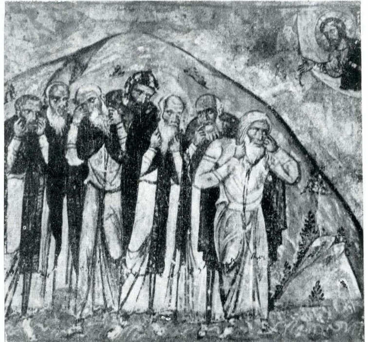
Fig. 8. Ms. grec 1294, f. 4 v.