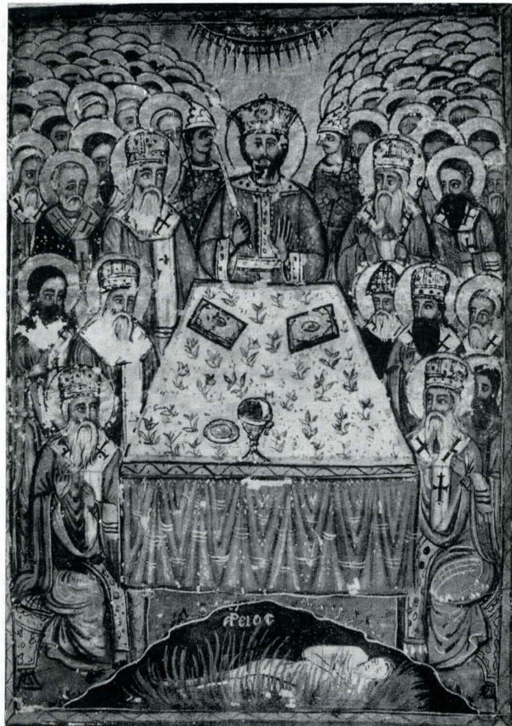
Fig. 13. Ms. grec 1149, f. 156 v; Primul sobor ecumenic.

La f.157 v este înfățișat al doilea sinod ecumenic, prezidat la Constantinopol de Teodosie cel Mare în anul 381, care a condamnat erezia macedonenilor. Față de tabloul precedent, miniatura aceasta diferă prin câteva detalii: împăratul este bătrîn, cu barba albă lungă, în aceeași atitudine ca și împăratul Constantin cel Mare. Deasupra lui, plutind pe norii cerului, Isus Hristos binecuvîntează cu amîndouă miinile. În prim plan, la picioarele mesei, doi eretici, neprecizați (probabil episcopii Eleusius de Cizic și Marcianus din Lampasc, susținătorii cei mai însemnați ai lui Macedoniu, patriarhul de Constantinopol 23 sînt înghițiți de două animale fantastice ale Infernului, reprezentat printr-o grotă întunecată. Fondul miniaturii este de culoare roz în registrul inferior și verde în partea de jos.