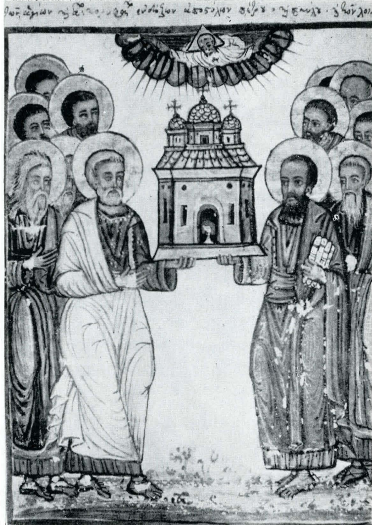
Fig. 12. Ms. grec. 1149, f. 131 v; Soborul Sfinților Apostoli.