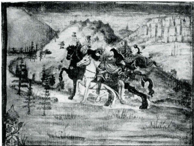
Fig. 1. Ms. grec 113, f. 10; Nașterea.