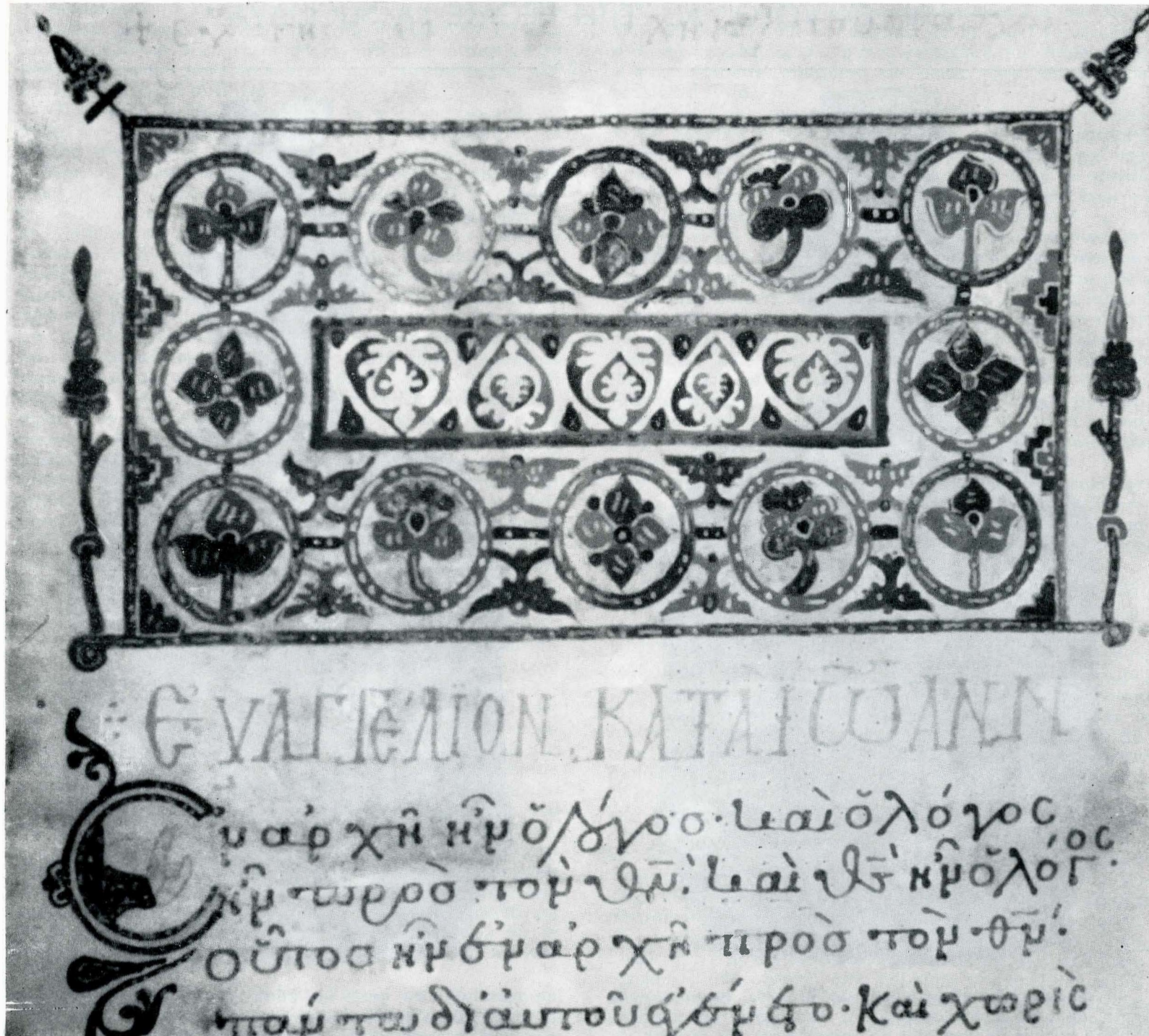
Fig. 33. Ms. grec 934, f. 1; Frontispiciu.

frontispiciile și majusculele (cîteva doar) Canonului de rugăciuni către Maica Domnului , manuscris pe pergament din sec. XIII, înregistrat sub nr. 261 52 ce împodobesc f. 1 (cel mai frumos dintre ele, este de inspirație geometrică și vegetală), f. 33 v , 55, 79, 103 v , 126, 150, și 173 (impleturi colorate în alb și maron). Sub nr. 665 se păstrează un Tetraevanghel pe pergament, din sec. XII, copiat într-o scriere mărunță 53 , care are și el patru frontispicii vegetale, în alb și sepia, la f. 2, 57, 90 și 152, remarcabile prin precizia desenului.