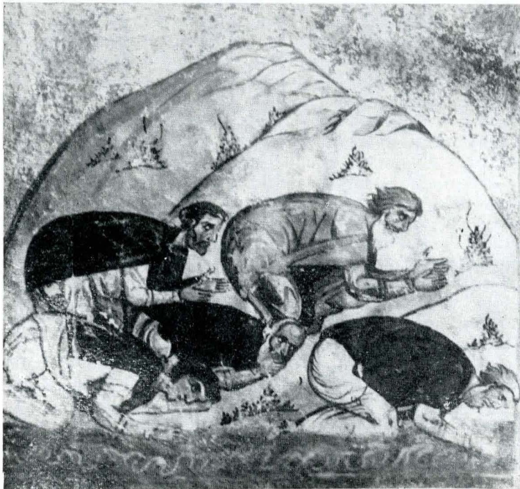
Fig. 9. Ms. grec 1294, f. 3 v.