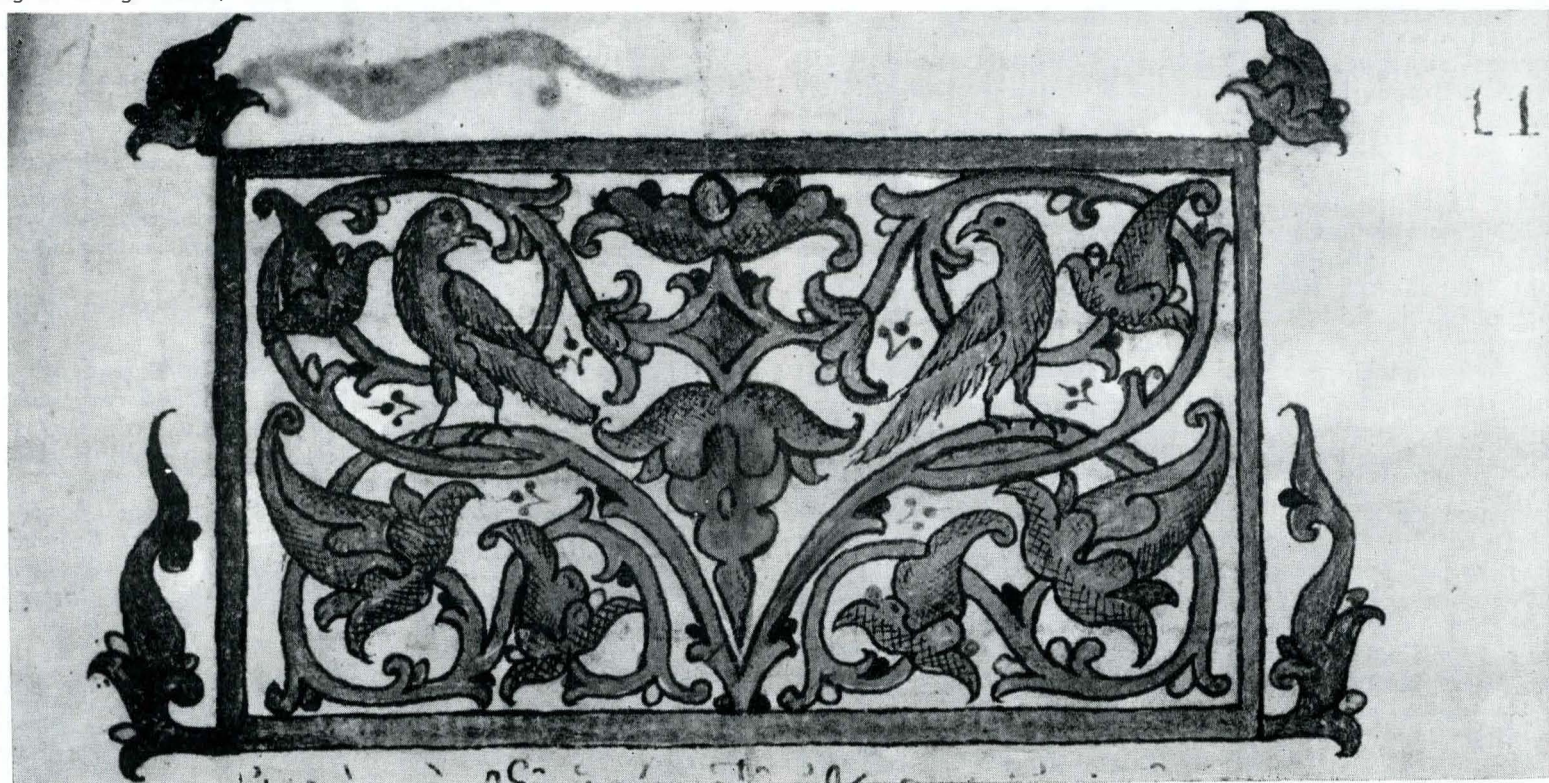
Fig. 23. Ms. grec 1096, f. 11.