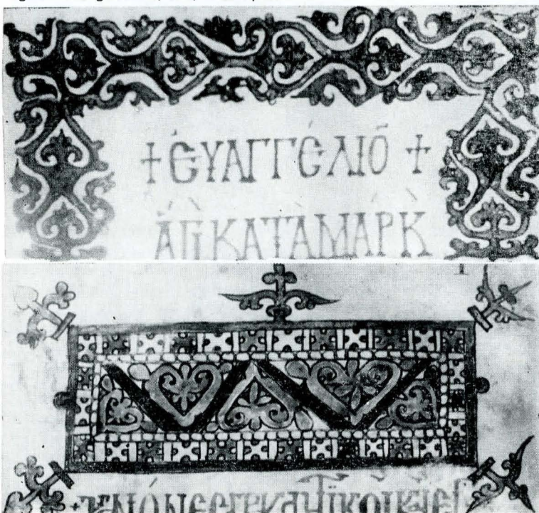
Fig. 30. Ms. grec 94, f. 120; Titlul Evangheliei de la Marcu. Fig. 31. Ms. grec 261, f. 1; Frontispiciu.