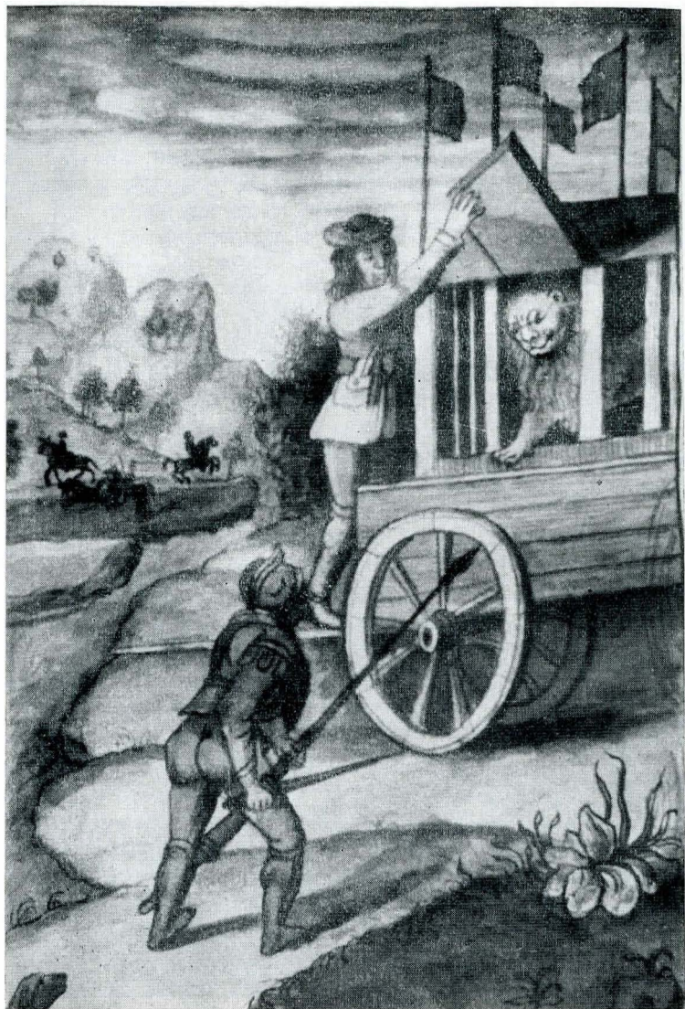
Fig. 16. Ms. grec. 1471, f. 127 v.; Don Quijote gata pentru lupta cu leul.

unui împărat (coloritul, la fel de viu, este completat de verdele, în care este redată mantia patriarhului), precum și miniatura de la f.97, care înfățișează un palat cu patru turle și cruci în vîrf, avînd porțile larg deschise. În fața palatului, într-o tîpsie se află un cap, al vreunui împărat bizantin, al cărui sfîrșit tragic va fi fost dinainte prorocit. Lipsa de perspectivă și de proporții în redarea palatului este suplinită și aici de coloritul variat: gri, albastru, liliachiu, roșu.