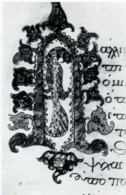
Fig. 25. Ms. grec 1444, f. 14 v.; Litera P.